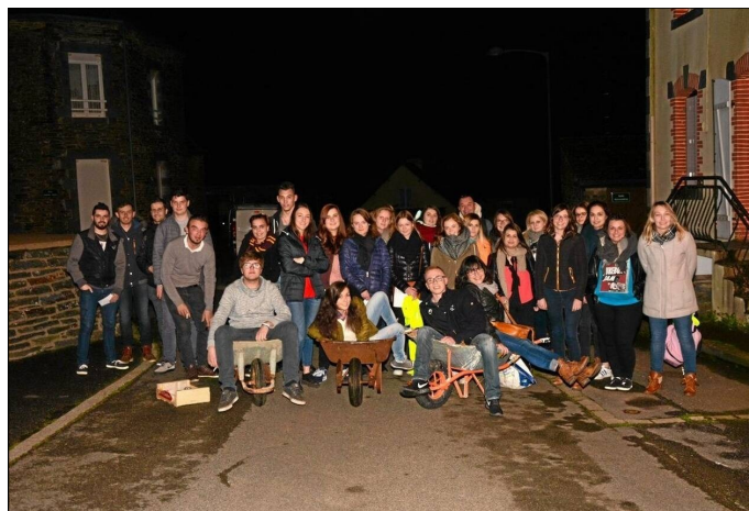
De nuit, les jeunes des Fougerêts (56) ont parcouru les routes de campagne à la rencontre des habitants pour collecter des œufs.

Quand ils arrivaient, ils disaient " La Passion du doux Jésus - Faot-i chanter ? ".