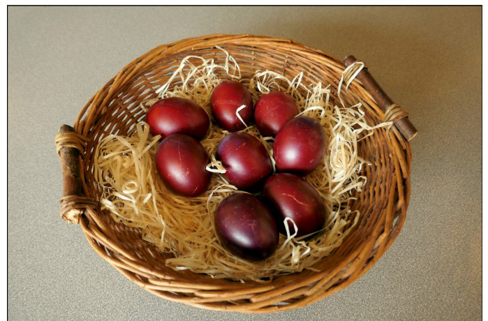
Un panier d'œufs rouges de Pâques préparés par Thierry Civel

Autrefois, nous racontent les gallésants, il était de tradition dans chaque famille, de colorer en rouge les œufs de Pâques, pour rappeler le sang du Christ. On utilisait pour cela des pelures d'oignons. Thierry Civel, président de l'association de bienfaisance du foyer de la Perrière, nous a apporté un joli panier d'œufs de Pâques. Nous l'en remercions bien chaleureusement.