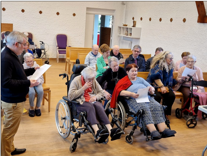
Les galozoueres et galozous ont chanté pour la signûre de la Charte.

Le vinte de mâr deûz mil vinte-catr, la Charte « du Galo, dame Yan, dame Vére ! » fut signée enter la souète « Association de bienfaisance », me-nouere du Fouyer de la Perriere, l'Institut du galo et la Rejion Bertègn.