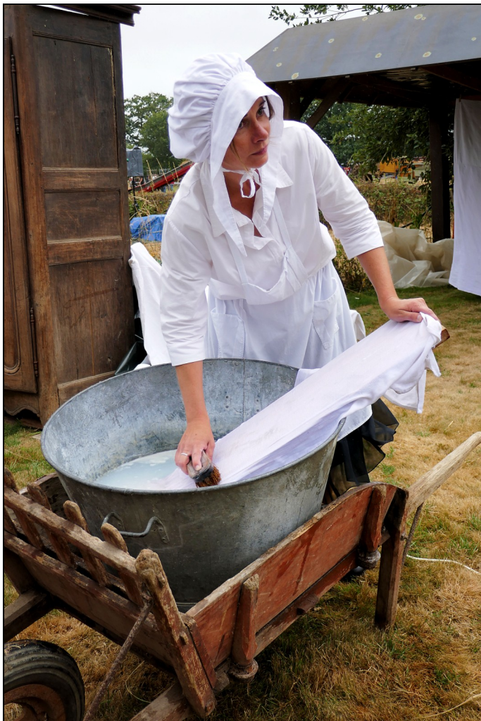
Décrassage du linge

Les premiers rayons de soleil d'avril annoncent le renouveau. C'est le moment de préparer les draps de l'hiver pour les laver. Le linge est d'abord mis à tremper la veille de la buée , puis décrassé énergiquement dans la bassine en zinc ou dans le baquet.