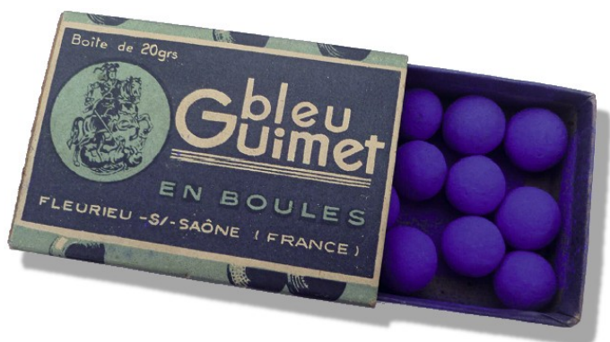
Boîte de bleu Guimet

Chaque semaine, plusieurs lieux emblématiques de Bretagne sont déclinés comme un itinéraire dans ce magazine de sept minutes, à voir sur France 3 du lundi au jeudi, dans le 19/20 Bretagne.