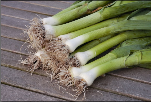
Le poireau : la poureuille [pɥɔvilj], la pou-raille [pɥɔʁaj] n. f.