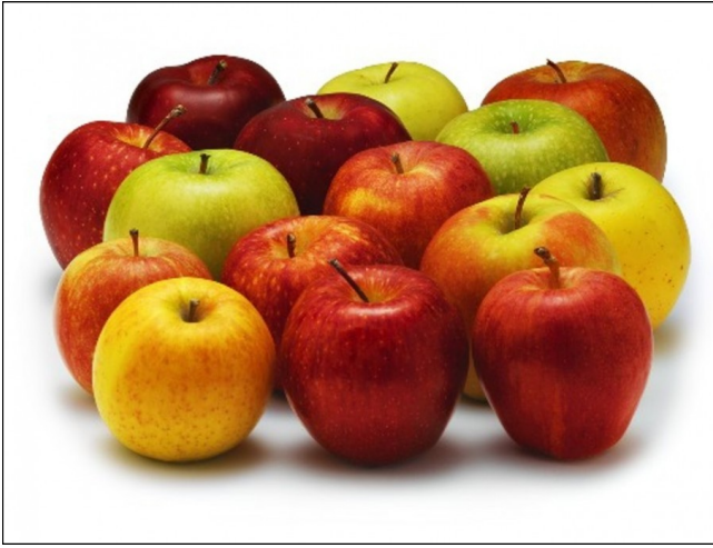
La pomme : poume [pum], ponme [põm] n. f.