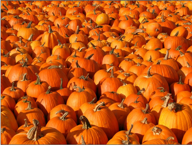
La citrouille : jotte [ʒɔt] n. f.

Cette séquence de l'atelier s'est conclue par l'écoute de la Leçon de gallo proposée par PLUM'FM avec l'émission LE GALO DEN LE PTIT-POST sur le thème "den le courti".