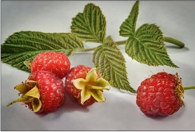
La framboise : frambouéze [fʁãboez] n. f.