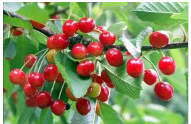
La cerise sauvage : ghigne [gɪŋ] n. f.