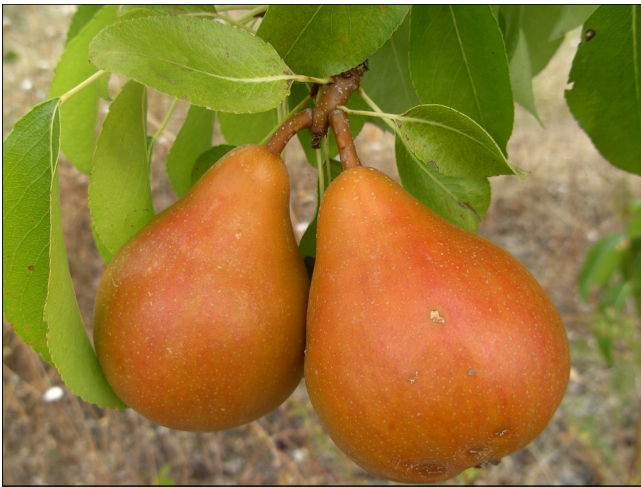
La poire : paï [paɪ], pare [paʁ] n. f.