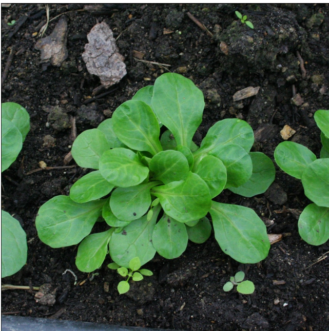
La mâche : bourssette [buʁsɛt] n. f.