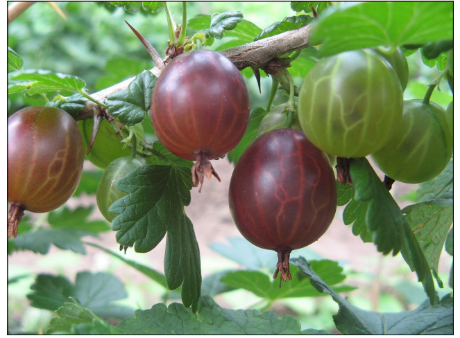
La groseille à maquereau : guernouézelle [gævnuezɛl] n. f.