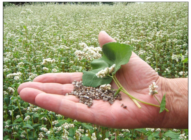
Le sarrasin : bié naï [bie naj] n. m.