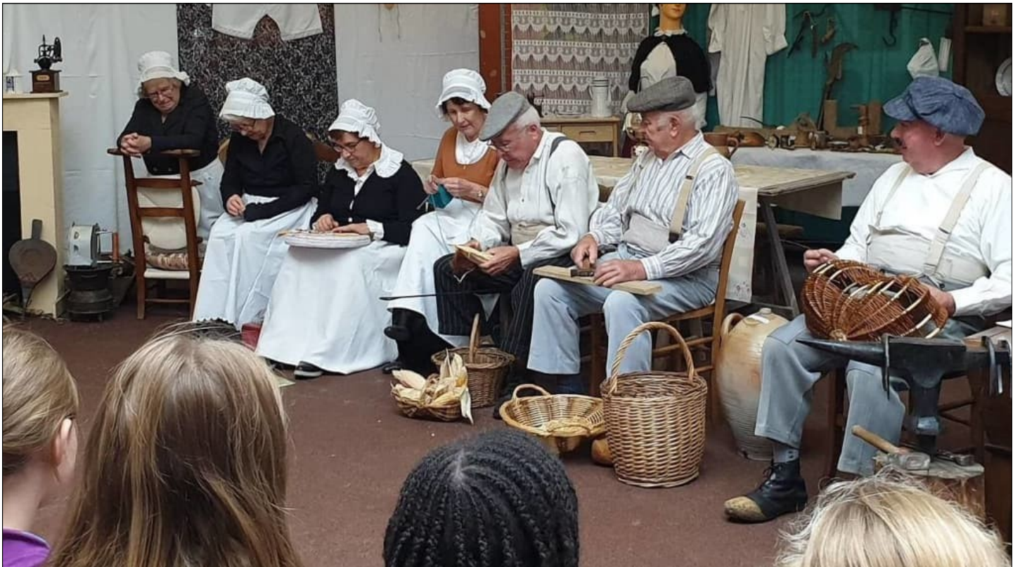
Retour dans les années 1950, quand il n'y avait pas la télé dans les foyers

A la fin, pour chacè le son.me qi gagnaet même les granwdes personnes, on