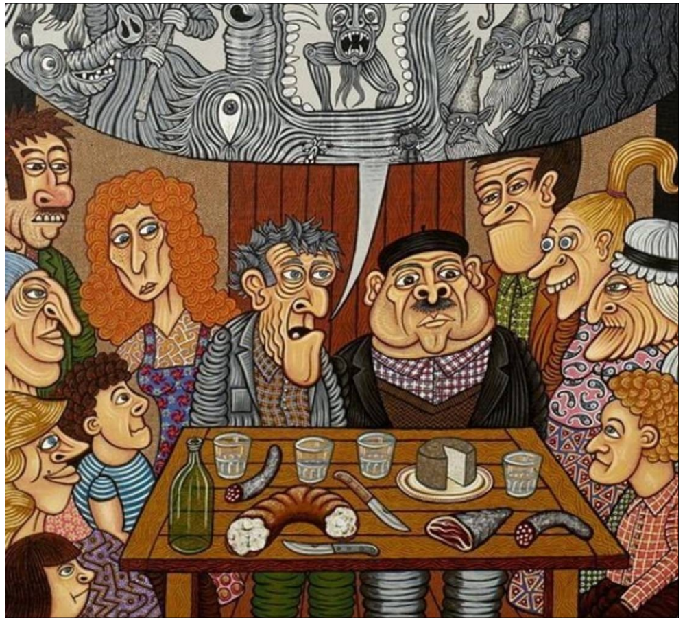
Dans le Velay, comme dans notre région, la veuilleille est un moment où on se retrouve pendant les froides nuits d'hiver, pour écouter et raconter des histoires parfois terrifiantes

Pis, La Rotte de feverië s'ét crouillée su la bouéte a mots jusq'a la perchene faï.